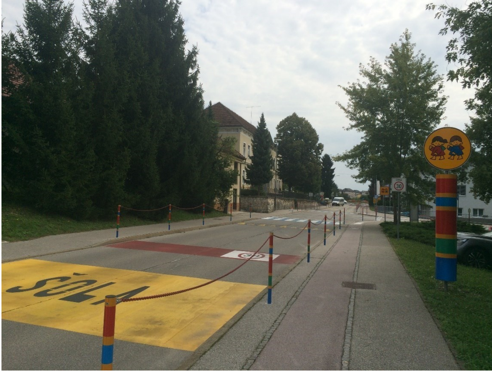
Cesta s talno označbo »ŠOLA«, opozorilno tablo in zaščitno verigo na pločniku