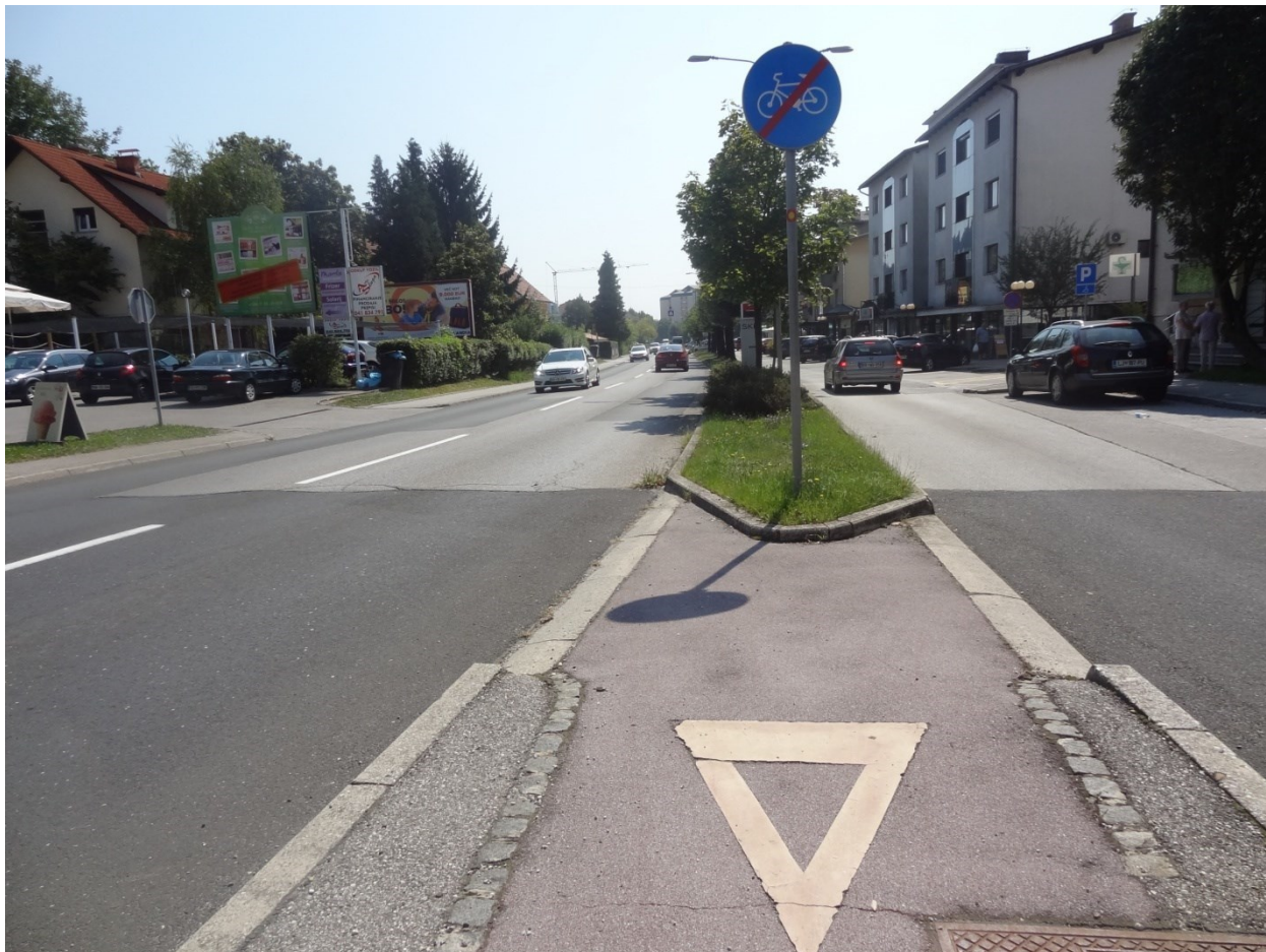
Nevarno vključevanje kolesarjev na cesto