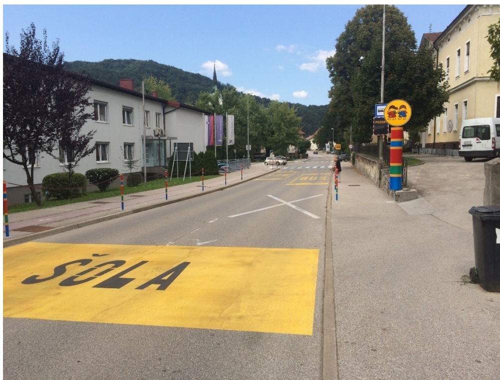
Dovoz na šolsko dvorišče in avtobusno postajališče na cestišču