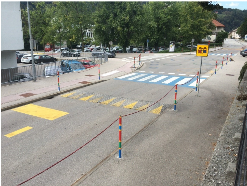
Prehod za pešce