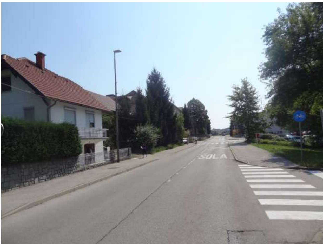
Cesta brez opozorilnih tabel »ŠOLA«