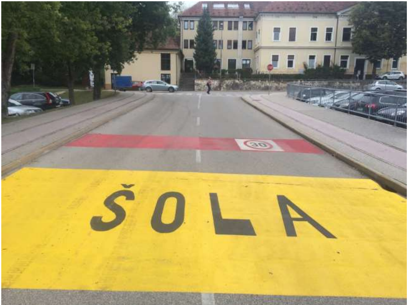
Cesta s talno označbo »ŠOLA«, vendar brez prometnega znaka