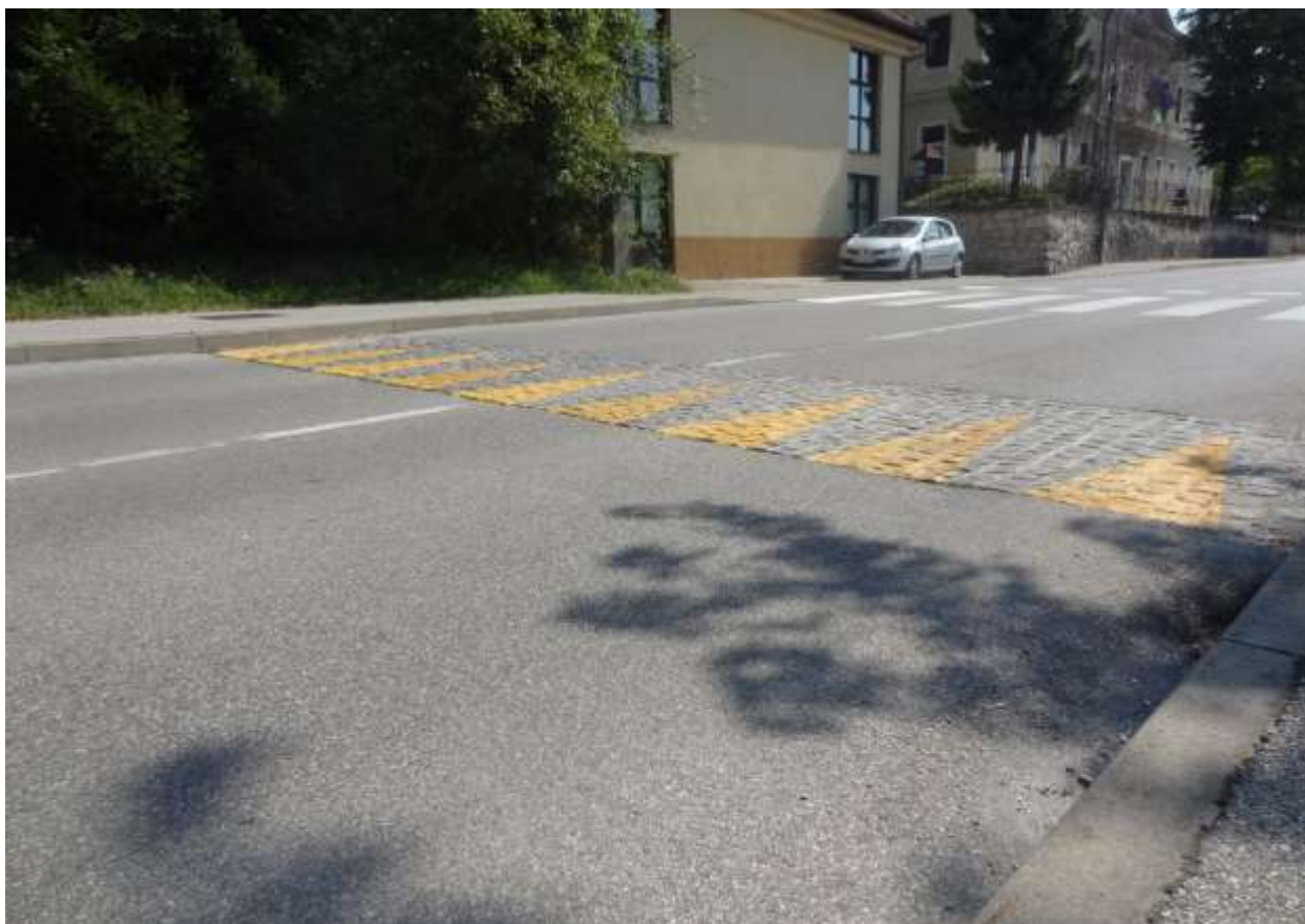
Neprimerne cestne grbine