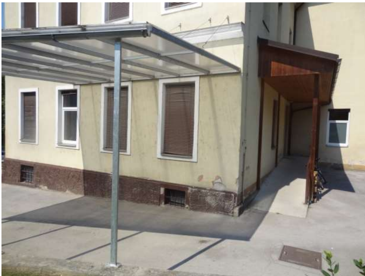
Drugi vhod v šolo