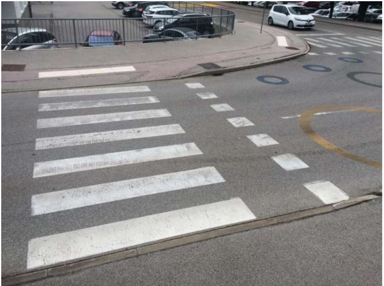
Prehod za pešce