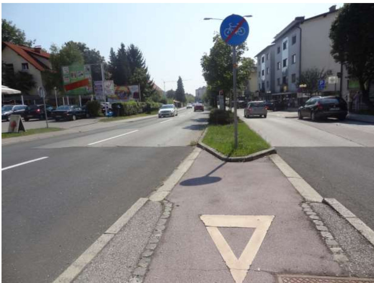
Nevarno vključevanje kolesarjev na cesto