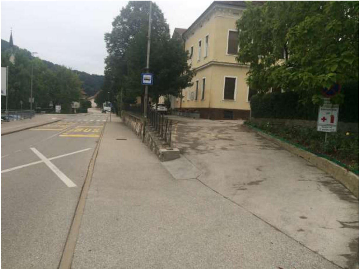
Dovoz na šolsko dvorišče