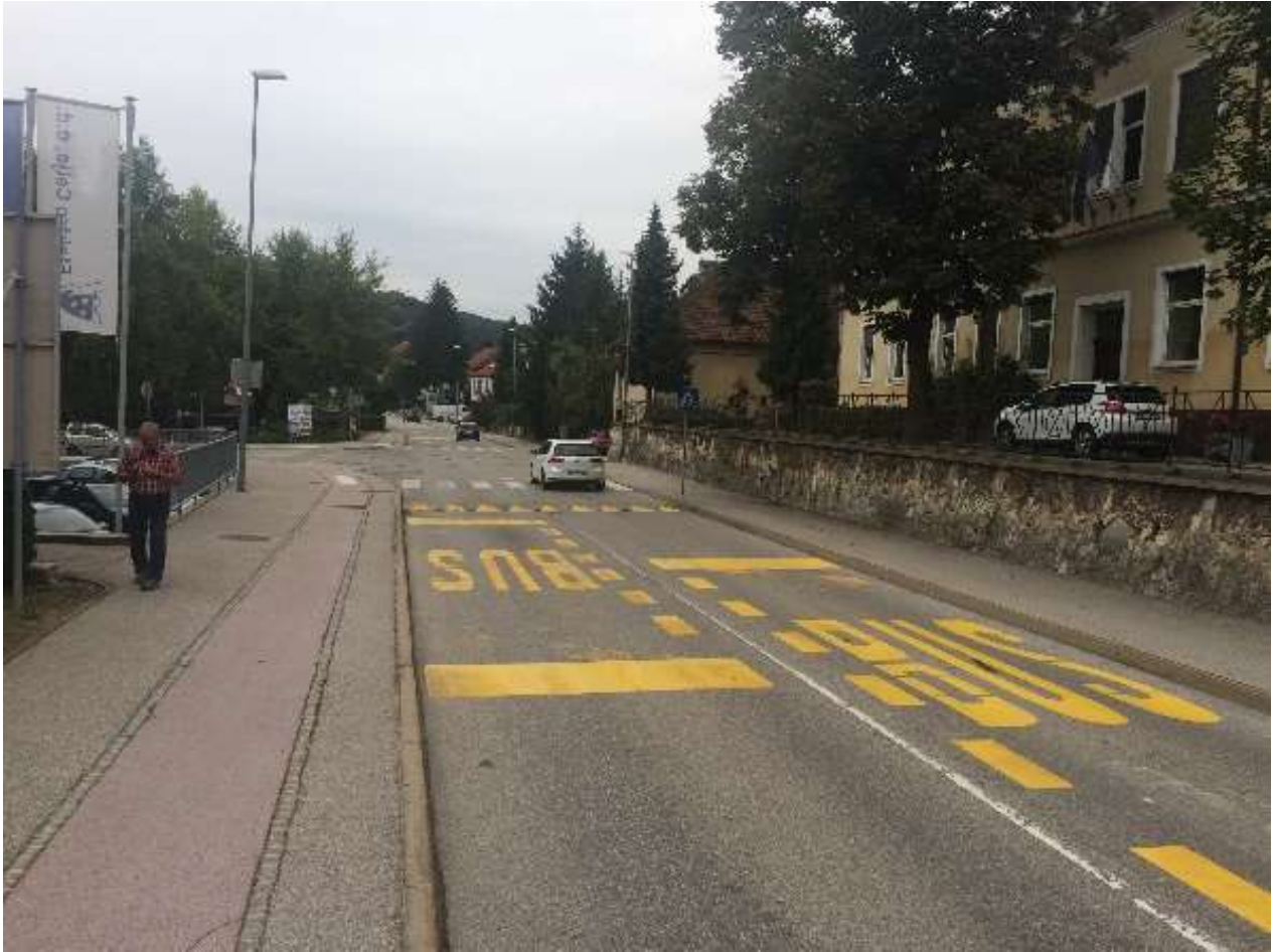
Avtobusno postajališče na cestišču